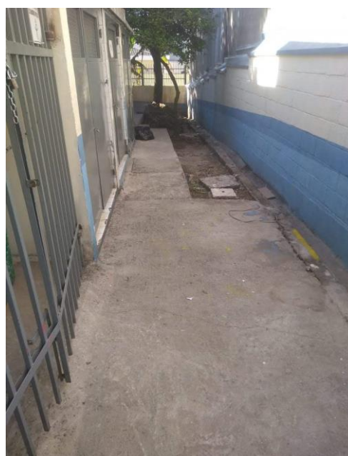
LATERAL DA UNIDADE ONDE SERÁ RELIGADO NOVO TRECHO