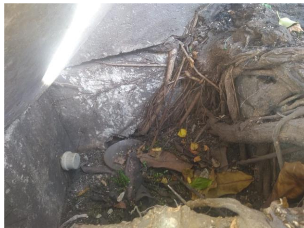
CAIXA DE ESGOTO INTERNAMENTE BLOQUEADA DE RAÍZES