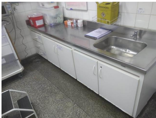
SALA DE EMERGÊNCIA